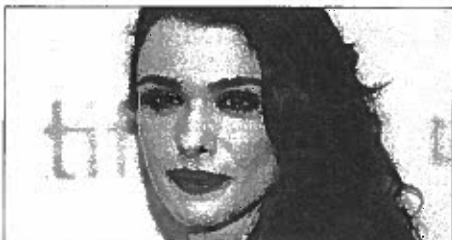
Rachel Weisz er en av skuespillerne i filmen 360.