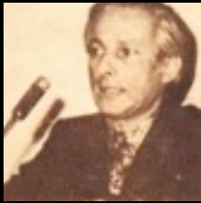
Samir Amin (f. 1931) Den egyptiske økonomen og forfatteren Samir Amin gjester Voksenåsen 30 januar. Amin er en legende og en av vår tids mest prominente sør-stemmer